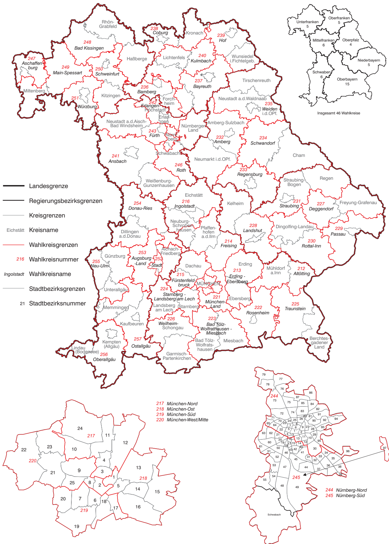
Abb. 1 Wahlkreis Bayern zur Bundestagswahl 2017